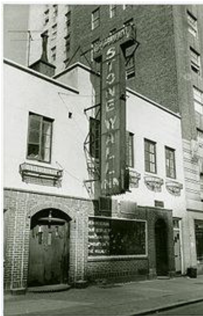
石牆酒吧，攝於1969年。窗內的牌子說：“基於同為同性戀者，我們請求眾同好維持村內街道上平靜安寧”

暴動就像其他的搜捕行動一樣開始。4個便衣警察和兩個身穿制服的警察在星期六凌晨1點20